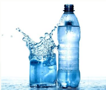
DELGO. Envase de água mineral. Disponível em: https://www.delgo.com.br/noticias/envase-de-agua-mineral.html . Acesso em: 13 abr. 2026.