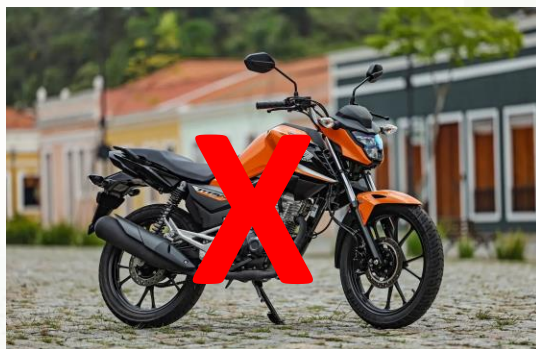
WEBMOTORS. Conheça as marcas de moto mais desejadas do país. Disponível em: https://www.webmotors.com.br/wm1/motos/conheca-as-marcas-de-moto-mais-desejadas-do-pais . Acesso em: 13 abr. 2026.