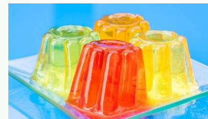
LIV UP. Gelatina é saudável? Disponível em: https://blog.livup.com.br/gelatina-e-saudavel/ . Acesso em: 13 abr. 2026.

Motivo: Evitar que os alimentos entrem no pulmão e melhorar a visualização da imagem, garantindo o sucesso do exame.