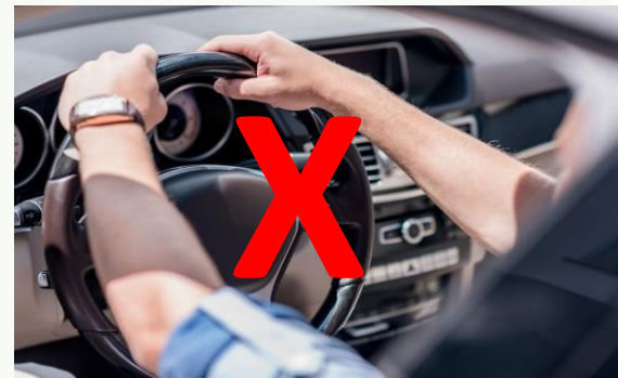
NAKATA. Qual é a melhor postura para dirigir? [imagem]. 2019. Disponível em: https://blog.nakata.com.br/qual-e-a-melhor-postura-para-dirigir/ . Acesso em: 13 abr. 2026.

Motivo: A sedação pode causar sono e tontura, sendo necessário ajuda para voltar com segurança.