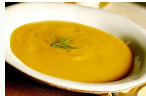
Sopa de legumes batida

RECEITAS DO CLAU. A proteína do frango é melhor que a do peixe? Disponível em: https://receitasdoclau.com.br/a-proteina-do-frango-e-melhor-que-a-do-peixe.html . Acesso em: 13 abr. 2026.