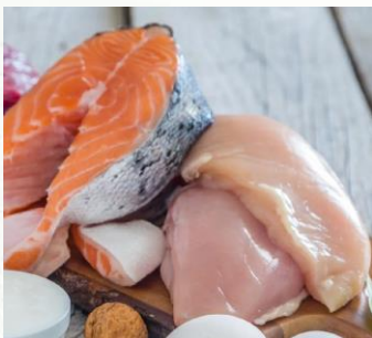
Peixe e Frango