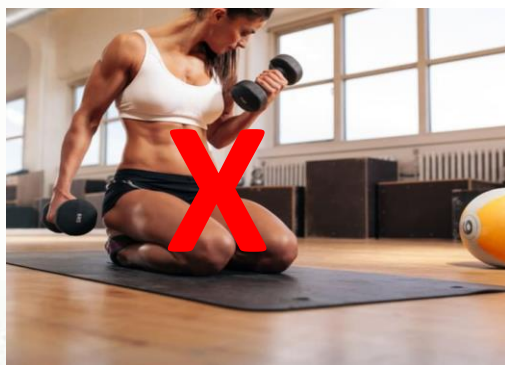
PRATIQUE FITNESS. Academia Pratique Fitness. Disponível em: https://pratiquefitness.com.br/ . Acesso em: 13 abr. 2026.