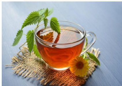
CICLO VIVO. Chá para plantar em casa: ervas, cultivo e benefícios. Disponível em: https://ciclovivo.com.br/mao-na-massa/horta/cha-para-plantar-em-casa-ervas-cultivo-e-beneficios/ . Acesso em: 13 abr. 2026.